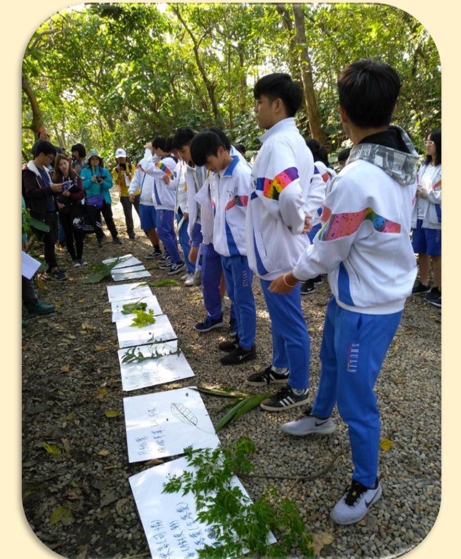
校園植物踏查活動 鹿角溪人工溼地踏查活動