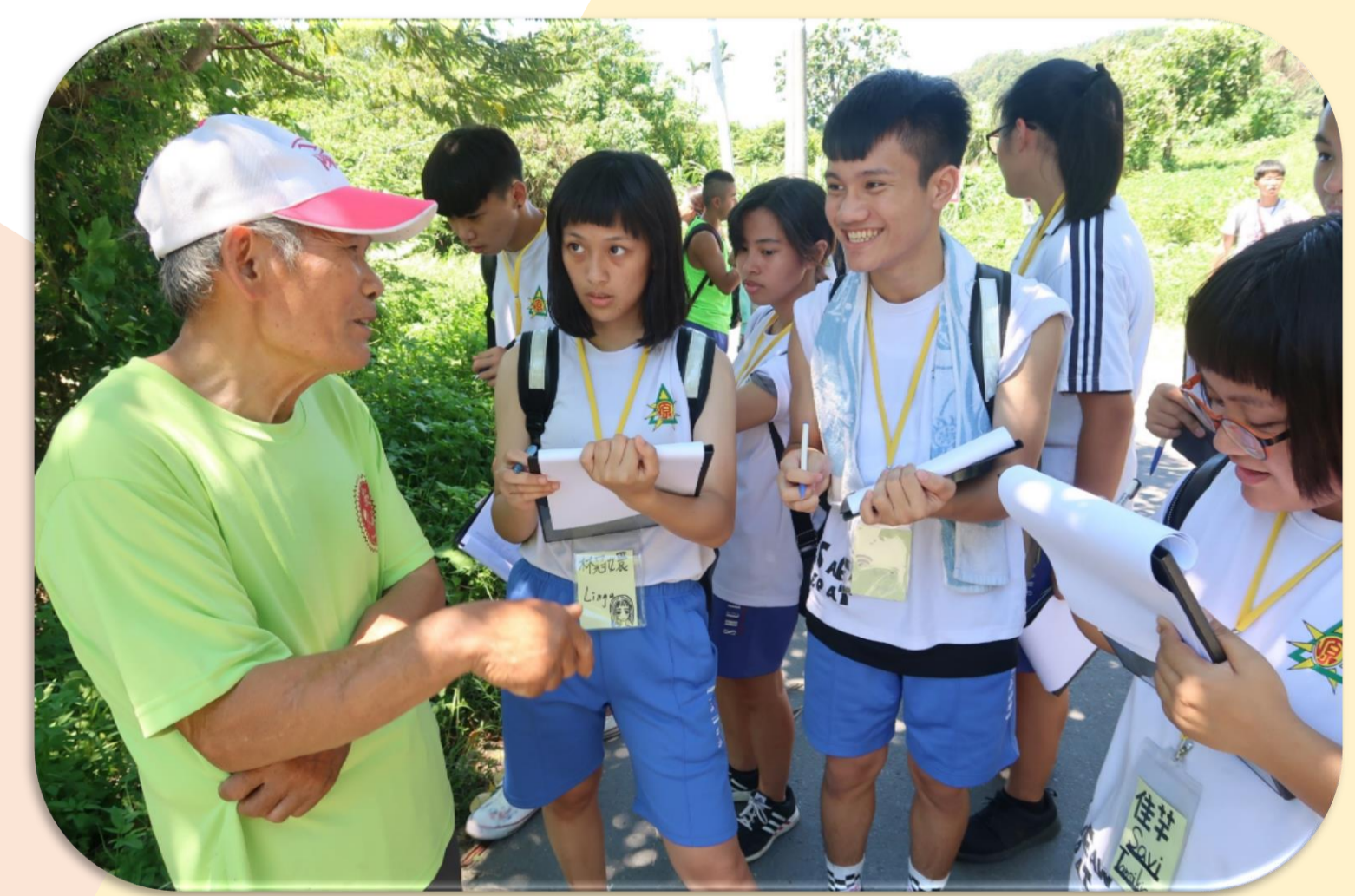
崁津部落踏查活動