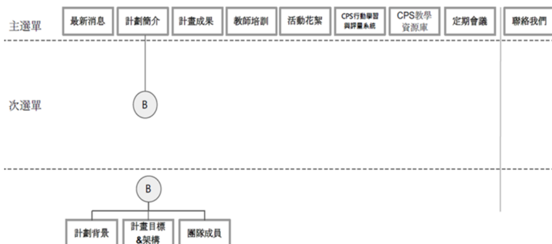
圖 2、原住民文化融入國小數理領域之 CPS 行動學習網站架構

本期計畫使用 WordPress 網站平台，該平台之特色可串聯許多社群媒體(如 Facebook、Twitter、google+等)，也可加入 Flickr、YouTube 等資源進入平台，可以讓學習資源類型更加寬廣，亦透過社群媒體讓學生的學習產生更多互動，同時也加強平台的推廣與傳播。此平台除了在 Web OS 上可管理與編輯外，Android、iOS (iPhone、iPod Touch、iPad)、Windows Phone 等各類型的行動載具上都可支援 WordPress 管理面板中的功能並且能夠管理 WordPress 上的部落格和用 WordPress 建立的部落格，大大的提升方便性與易用性。