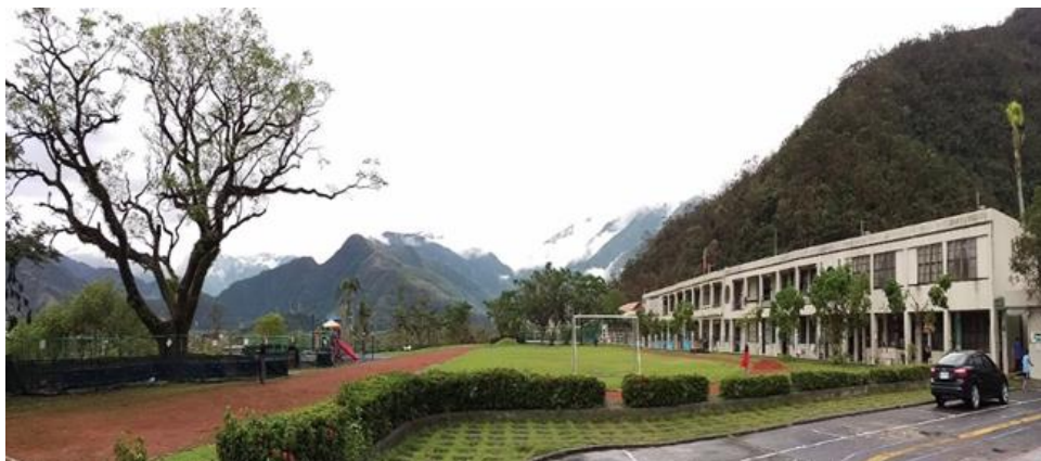
圖 1、宜蘭縣南澳國小校園

多皆為泰雅族人，故本課程、教材與評量皆融入泰雅族文化元素特色，從學生自身的文化經驗與情境出發，並增強其對自身族群文化的情感連結。