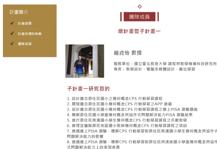
圖 4、計畫簡介-團隊介紹