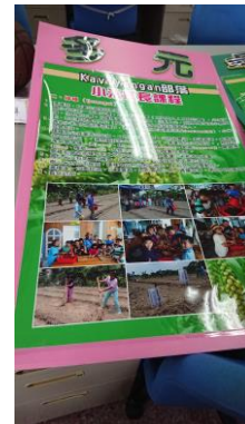
↑校方會集結課程所得印製成果海報，圖中為小米課程環境教育的內容