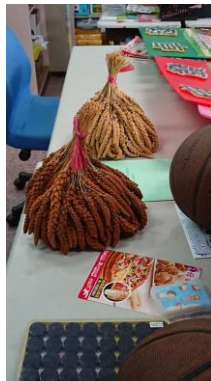
↑教師桌上所置放的小米課程教育教材