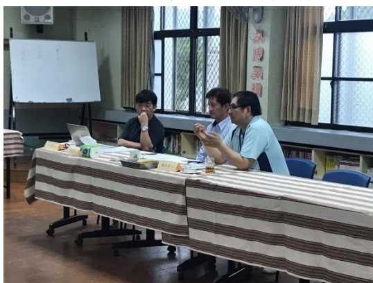
↑校方由校長及教導主任代表出席