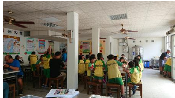
↑與全校師生共進午餐，餐廳牆上貼滿食農與環境教的海報