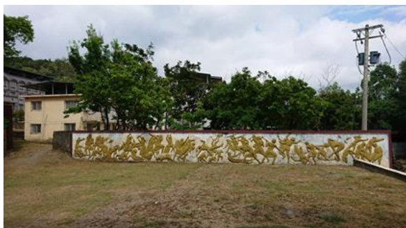
↑圍牆上牡丹社事件的精美圖騰