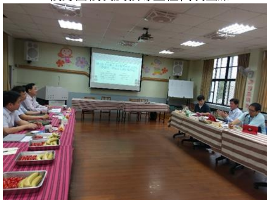
↑由雙方進行計畫期望協商