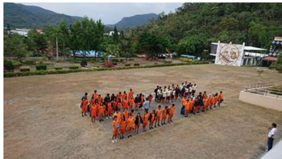
↑雖然只有寥寥學生，合唱團却年年代表屏東進軍全國大賽