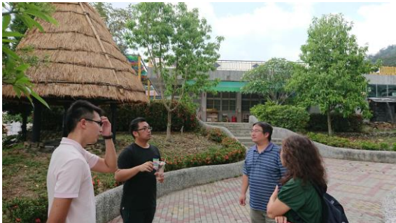
↑下午與研究團隊來到武潭國小分校之一的佳平分校參觀