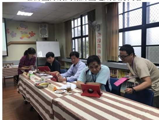
↑計畫示範與介紹目前媒體平臺架設與操作