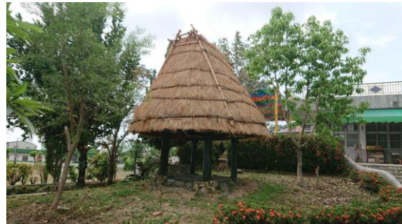
↑佳平分校內仿製的排灣族傳統穀倉，穀倉的建置充滿了傳統智慧與美