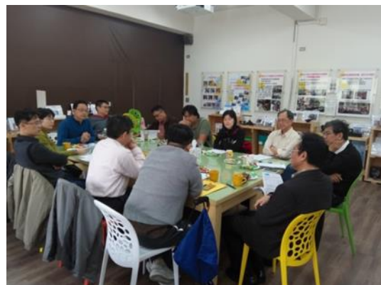
↑ 2018.02.01 專題課程檢討會議。成大團隊與來義高中校長、教務主任及實驗專班老師討論及檢視上學期專題課程施行狀況

106 學年度上學期課程結束時，本計畫亦施行課程成效問卷調查，針對課程是否有助於學生「對周遭環境的認識」、「對排灣族傳統知識與文化的認識」、「對數理科學更有信心」等施測，多數學生皆有正向回饋。