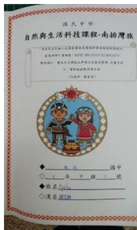
←學生所使用的健康醫療與環境科學課程教材，由華老師團隊所研發印製，並於實驗教學中使用