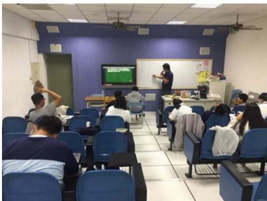
↑ 2017.12.15 專題課程