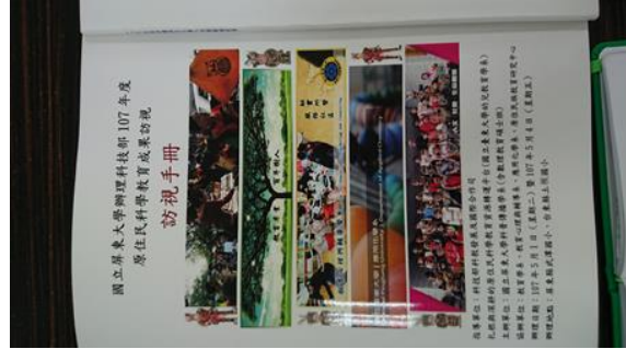
↑研究團隊貼心印製該整合型計畫各計畫之年度執行報告匯整，利於檢視