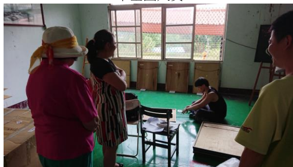
↑華老師與順益博物館借展於牡丹國中，並導引台科大學生至偏鄉服務，精神可嘉