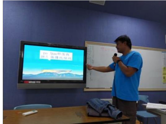
↑ 2017.11.15 專題課程