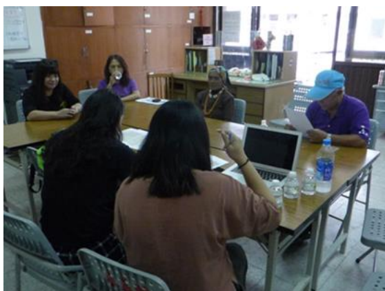
↑ 來義部落遷移史訪談

研究計畫執行至今，已至來義部落、舊白鷺、老七佳、望嘉部落等實行田野調查，訪談主題包含部落傳統領域、遷移史、五年祭等，透過耆老口述歷史、族人帶領實地踏查、觀察文化祭儀等，再再感受到排灣族豐厚的歷史、文化及生活智慧，本計畫將持續進行田野調查，蒐集更多族群知識，並結合文獻資料探討，梳理出科學課程的素材。