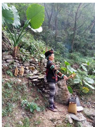
↑ 老七佳田野調查，靈媒進行入村祈福儀式