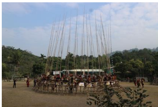
↑ 望嘉部落五年祭儀式觀禮