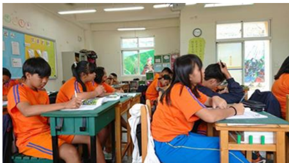
↑示範教學並展示研發教材使用狀況