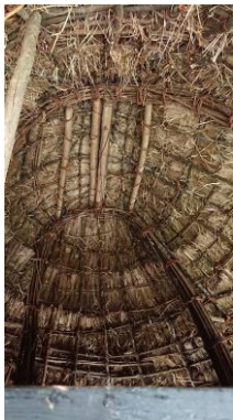
↑穀倉茅、藤、竹共同交織出力學、美學與環境科學的結合