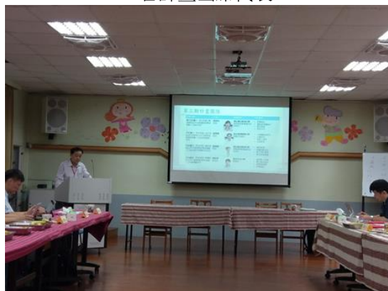
↑各計畫分別簡報計畫近期執行內容