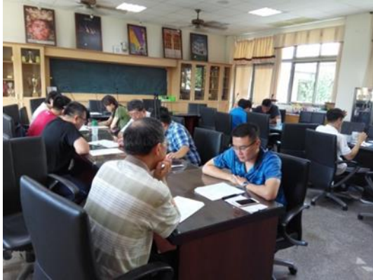
↑ 2017.08.30 成大理學院教授與來義高中實驗班任課老師討論專題課程規劃

功大學理學院科教中心、物理系、化學系、生科系、數學系及電漿所教授共同授課，並由本計畫共同主持人協助進行教學評量。