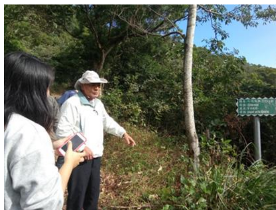
↑ 舊白鷺部落踏查，耆老講述部落歷史及故事