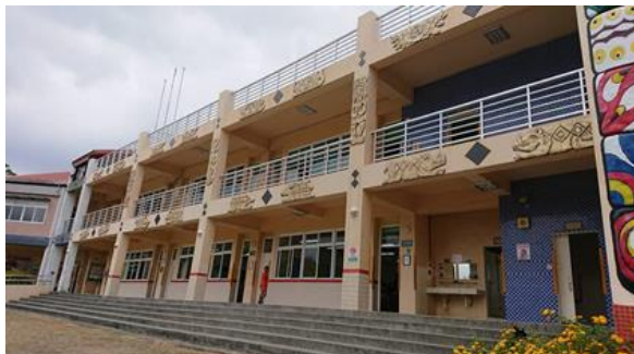
↑牡丹國中美麗的校園