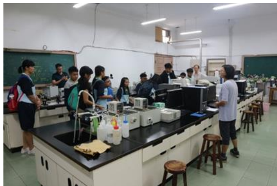
↑ ↓ 邀請來義高中原住民族實驗專班學生參觀成大研究室、科學教育中心，並安排科學遊戲實作