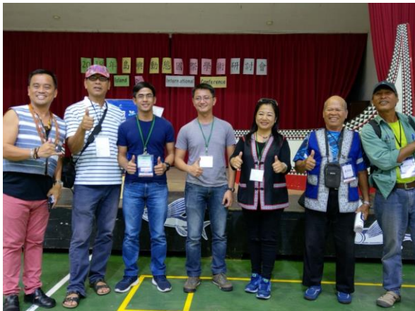
開幕式：蘭恩幼稚園