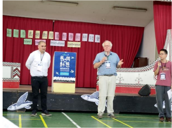
開幕式：蘭恩幼稚園