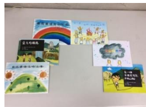
第四期：賽德克族文化