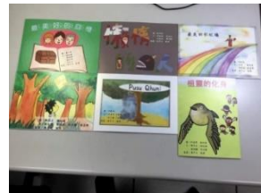
第六期：賽德克族文化