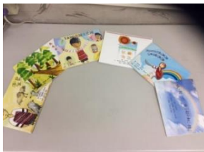
第二期：賽德克族文化