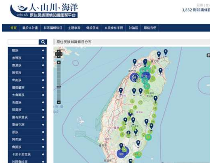
圖 1、原住民族環境知識匯聚平台

本團隊前期以自發性地理資訊 (Volunteered Geographic Information, VGI) 之概念建構了一套「人、山川、海洋 - 原住民族環境知識匯聚平台」( http://iknowledge.tw )，如圖 1 所示。此一知識平台翻轉了過去由上而下的權威編纂方式，而是開放給所有人都可以編輯，讓每一位原住民族人作為主動的知識提供者，由下而上地累積成原住民族地理環境知識庫，以確保知識條目之在地性與原住民族主體性。而平台採用多語系設計，因此可以讓各族族人以族語來編輯自己的環境知識，一方面可以保存族語文化，另一方面也能避免知識條目因翻譯過程而喪失原意，而同一知識條目也可以透過切換族語來作不同族群之間的知識參照。截至 108 年 5 月 1 日止，已有 389 位使用者註冊帳戶，累積 1832 條原住民族環境知識條目。