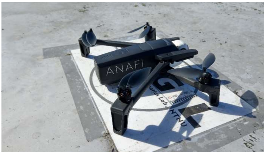
圖2、法國Parrot公司出品之ANAFI超輕便型四旋翼無人飛行載具

本團隊第二年度之目標為「以無人飛行載具(Unmanned Aerial Vehicle, UAV)航拍建構三維虛擬原鄉」，與部落及學校合作，採用如圖2所示法國Parrot公司出品之ANAFI超輕便型四旋翼UAV，航拍部落及其傳統領域。儘管大疆創新(DJI)生產的UAV在全球市佔率高達7成，但是大疆為中國大陸品牌，有內建「後門」程式的疑慮，美軍曾於2017年8月宣布停用並廢棄所有大疆UAV產品。本計畫使用UAV所空拍之影像乃用於產製高精度地圖及三維空間資訊，若使用大疆產品，將冒著機敏資料被傳回中國大陸的風險。因此本計畫採用法國Parrot公司出品的四旋翼UAV：ANAFI，全機展開後小於一張A4紙，重量約320公克，單顆電池可滯空飛行最長25分鐘，最遠遙控距離達4公里，最高飛行高度可達海拔4,500公尺，最快飛行速度達每小時55公里，可抵抗最高每小時50公里之強風。ANAFI內建1/2.4” CMOS影像感測器，拍攝影像解析度達2,100萬像素，亦可錄製4K超高解析度影片。