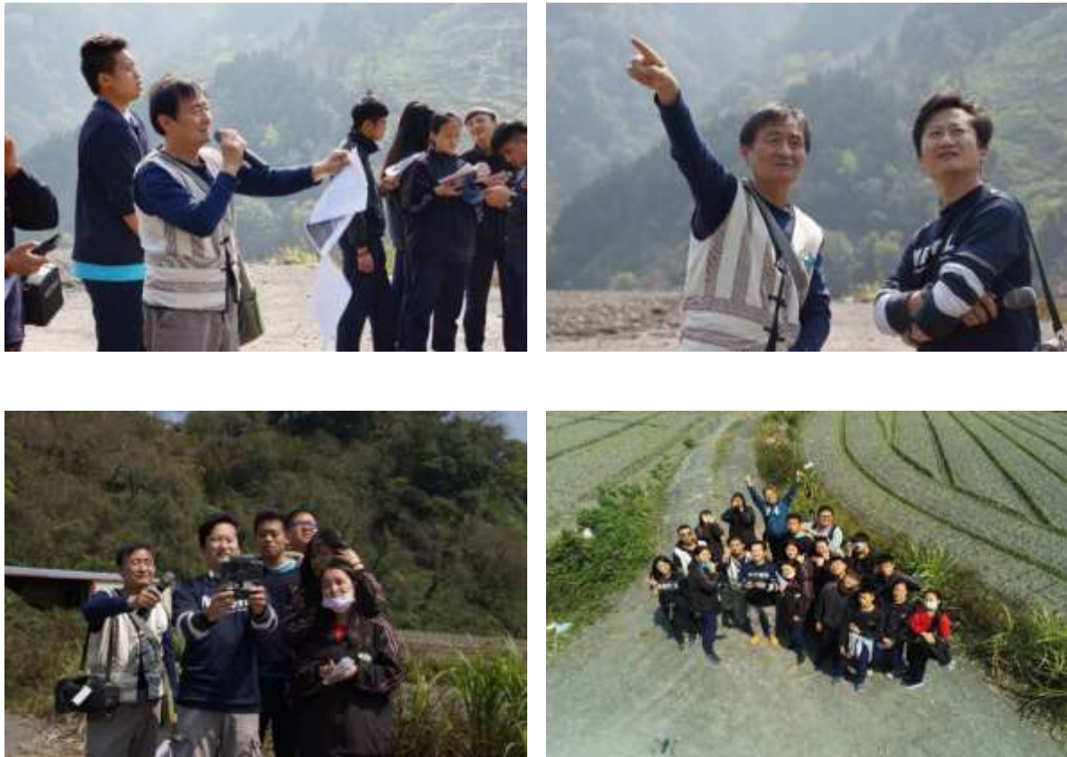
圖6、宜蘭縣大同國中3月20日課程花絮

除了正射影像鑲嵌圖及三維數值地表模型之外，為讓虛擬原鄉能夠有更沉浸式的體驗，本計畫也利用Ricoh Theta V全景相機，在大同國中內幾處重要地點拍攝360°全景影像，如圖7所示。後續會透過Unity軟體製作沉浸式虛擬實境，使用者可以透過簡易的Cardboard裝置或高階的虛擬實境眼鏡，完全進入虛擬實境的世界，猶如漫步於虛擬原鄉之中。