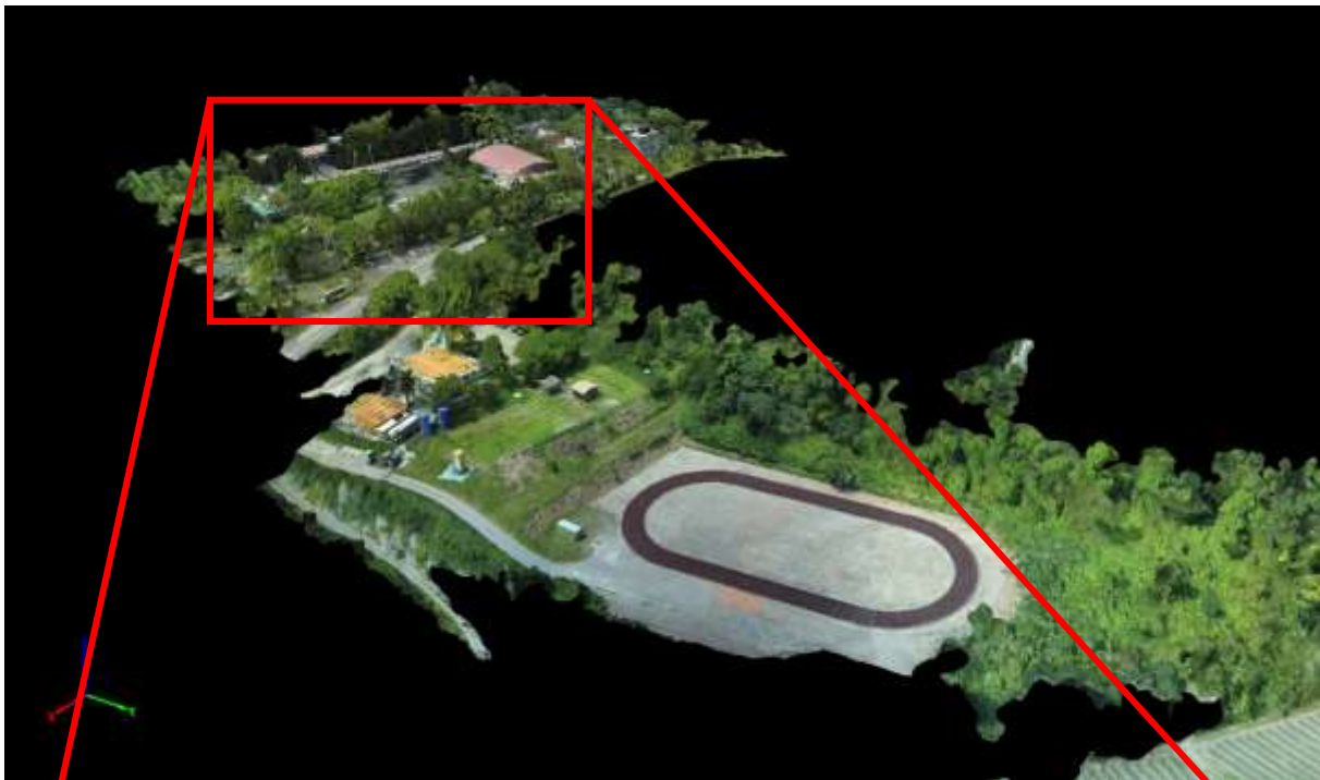
(a) 三維數值地表模型(3D Mesh Model)