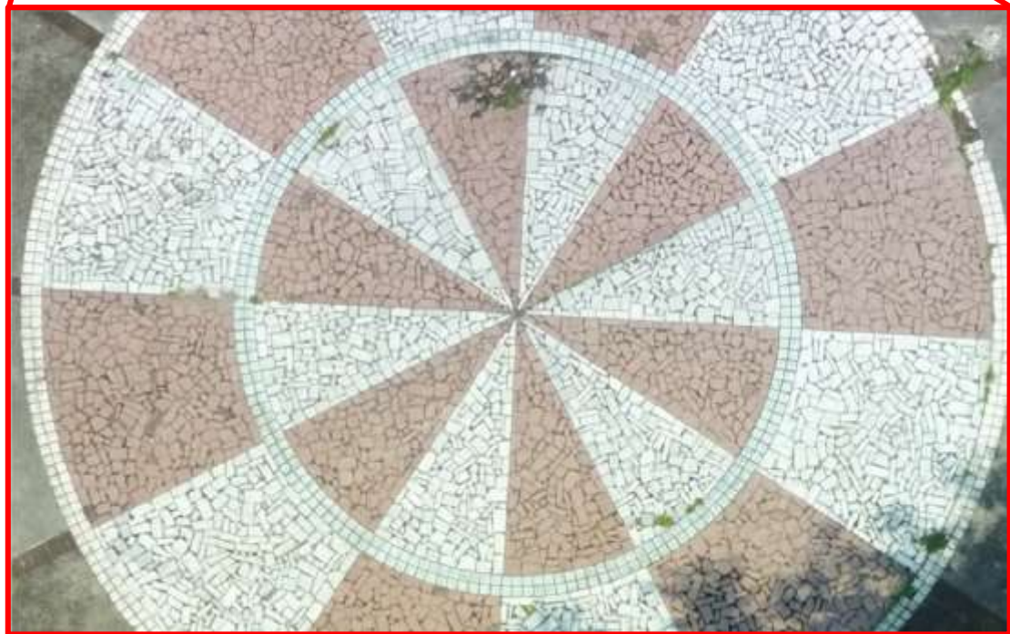
(b) 三維數值地表模型之局部放大（教室區）