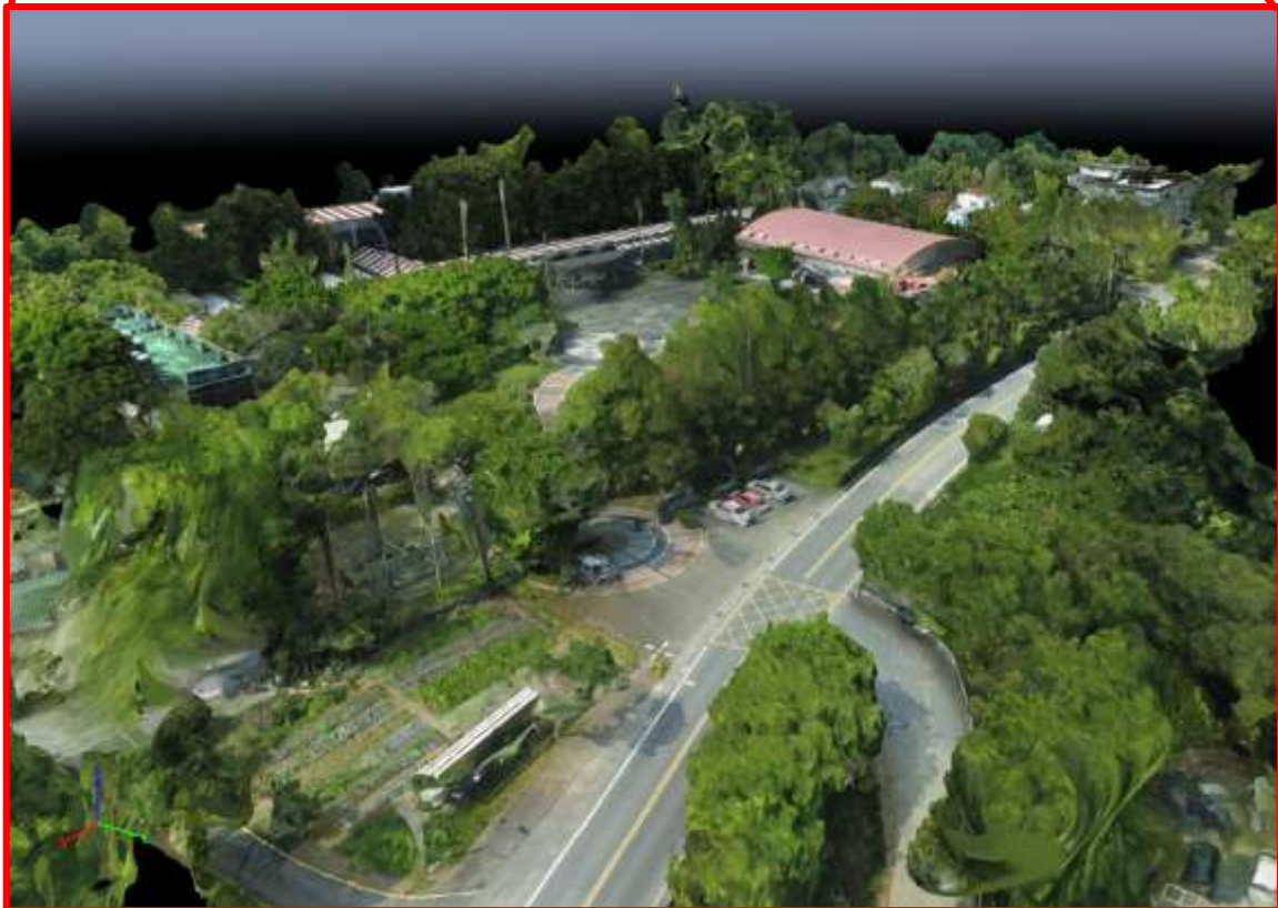
(b) 三維數值地表模型之局部放大