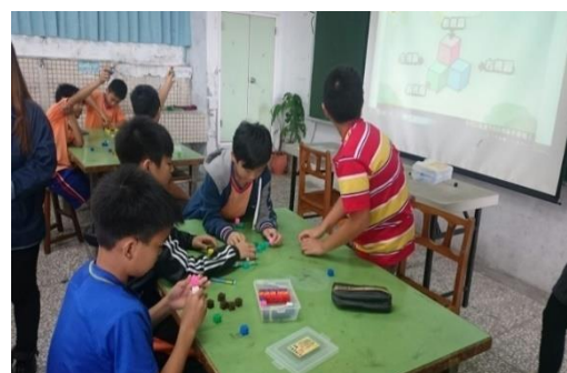
圖 2、「堆疊」單元教學示範活動