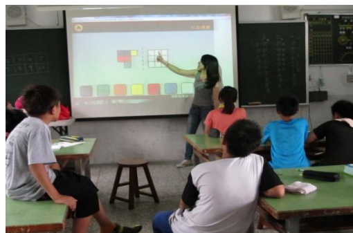
圖 1、「映射」單元教學示範活動