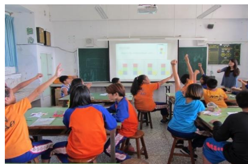
圖 4、「摺合」單元教學示範活動

目前研究面臨的問題是偏鄉網路頻寬略顯不夠，有時無法順暢使用網路平台即時評量並記錄學習歷程，以及具有數學、科學背景且能以原住民母語進行教學的師資難覓。除此之外，有些原民部落地處偏遠不便參與培訓推廣活動，因此未來希望加強平台宣傳服務，擴大 CPS 教學示範推廣範圍，並將現有教學平台延伸為行動教室模式，讓教師與學習者可透過行動載具進行線上課程、教案設計、無紙化即時評量、教材瀏覽等多元化課程活動與師資培訓。同時可利用此平台進行大數據資料蒐集與分析，以更加瞭解原民學童的學習方式及有助提升學習成效的課程設計模式，希冀經由本計畫「豐富多元的大平台」為原住民的學生帶來更多學習資源，進而產生正向的改變