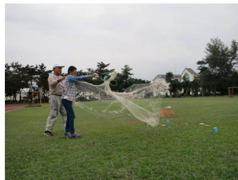
↑ 非制式化的學習變得活潑有趣，更加貼近原住民族的生活。

針對科學營相關活動關卡亦設計活動評量工具，來檢測參與科學營活動前後的學童在「情境興趣」、「科學探究」、「學習成效」三個面向之成效，而研究數據顯示確實有顯著的提升，105 年也開始嘗試以「六力雷達圖分析法」(記憶力、了解力、應用力、分析力、評鑑力、創造力)，將學生的表現，回饋給學校以及教師該校學生各項能力發展程度，提供學校後續課程活動安排的依據。這些數據都顯示出原住民族學生在接觸遊戲後科學能力的精進，而活動評量模式之建構不只可以用於非制式化教育活動中，隨著教育方式多元化方式之推展，正式化學校教育也納入非正式教育課程，此評量工具未來也可納入評析學校正式課程之評量方式。