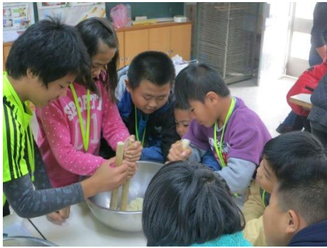
↑ 在活動中學習著與他人合作，發揮團隊精神，就能解決問題。