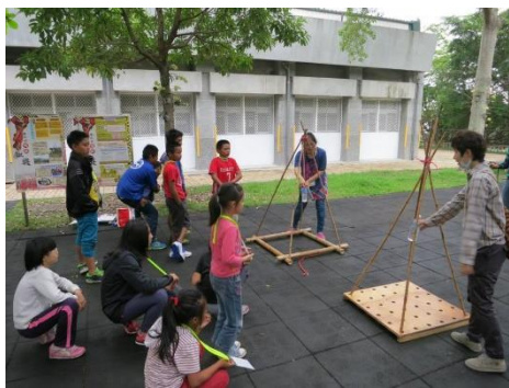
↑ 傳統鞦韆的架設蘊含了祖先的智慧，盪鞦韆儀式也象徵著尊貴的身分與地位。