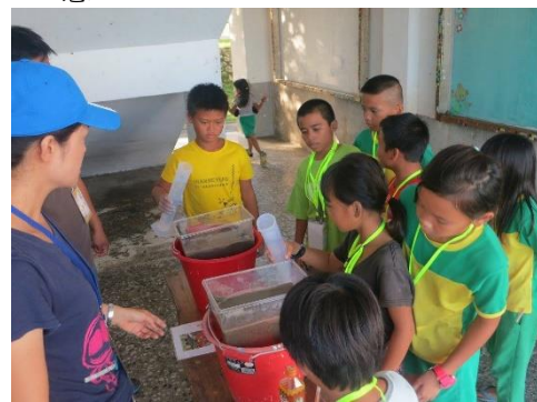
↑ 透過實驗操作，更能理解傳統地下屋建築的奧妙。