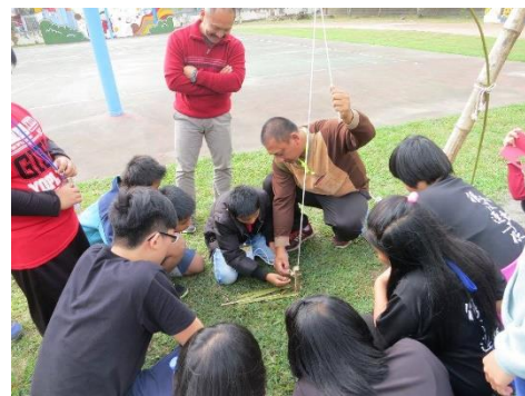
↑ 利用天然的材料製作狩獵陷阱，遵循著大自然的法則，讓生態源源不息。