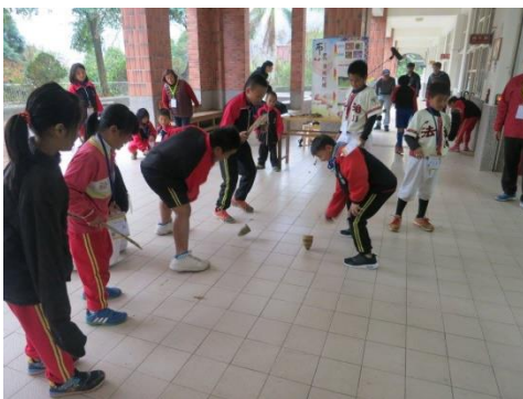
↑ 對於布農族來說，陀螺不僅是童玩，在歲時祭儀中也扮演著重要的角色，轉動越快，意味著小米的收成更好。