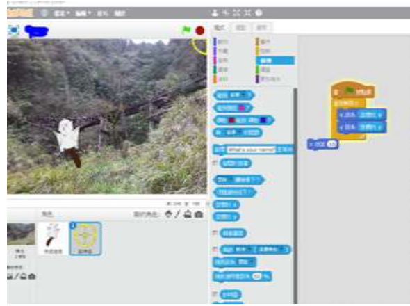
學生作品：獵飛鼠小遊戲