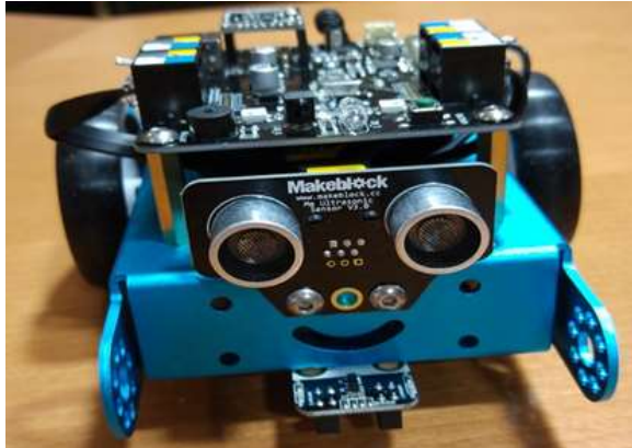
M bot 機器人