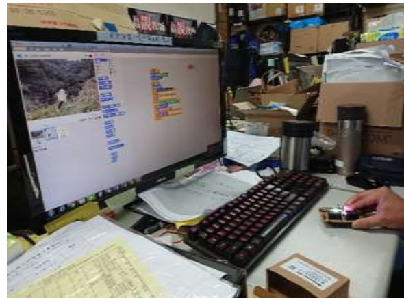
創客式教材 Arduino Uno