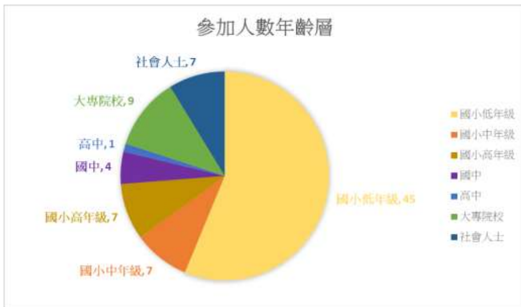
圖 5 參加闖關活動人數統計