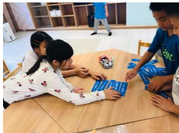
學生分組討論排列積木