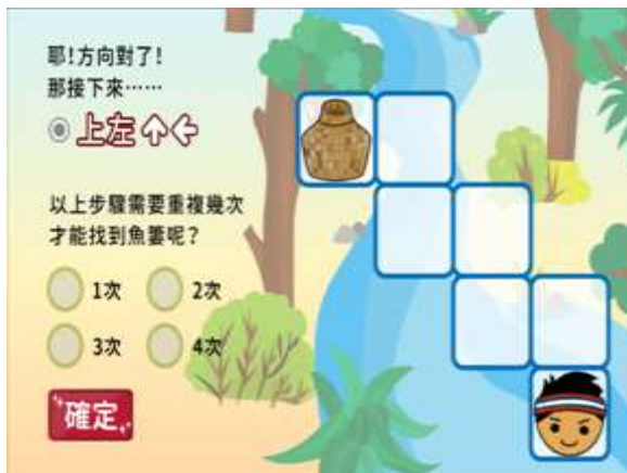
找寶藏遊戲：迴圈概念應用