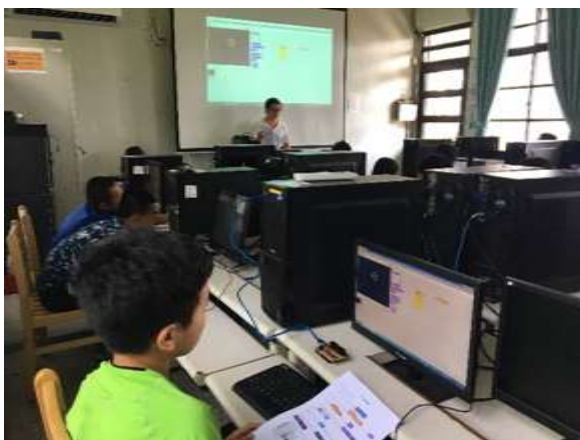
學生操作 Arduino Uno

後續課程將持續根據原住民課程發展原則，強化師生之間的互動性課程，並持續推廣至南澳、尖石等地其他學校，加入創客式機器人教材，例如M bot、程小奔，增加課程活動的多樣性。