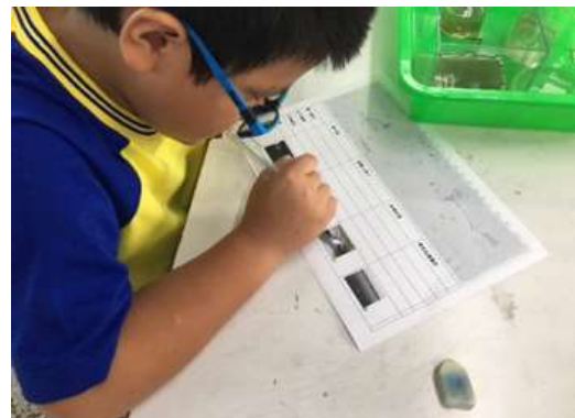
圖 8、利用武潭部落周遭地圖進行教學