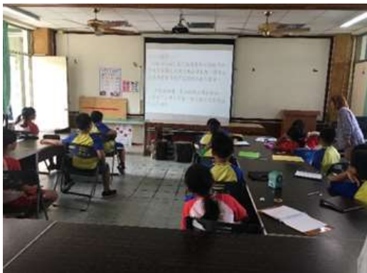
圖 5、帶領學生閱讀情境文本

學生在學習單中，透過武潭部落的周遭地圖，簡易標示四大水域的代表地點如表2，藉由自己熟悉的地名來認識水域的不同。地標由東至西是武潭瀑布、萬巒新厝、萬巒三溝水與潮州橋；水質的變化顯示武潭瀑布最乾淨、較西邊的萬巒三溝水次之、較東邊的萬巒新厝反而汙染較多，而汙染比例最重的便是最西邊的潮州橋。原來佳平溪另有一條支流流入三溝水，稀釋了原本應該比較髒汙的三溝水流域；而新厝因為少了乾淨河水的流入、再加上在地養豬戶多，便造成三溝水的水質反而優於新厝的原因。透過教師說明，學生便可認識到有時水質乾淨度並不是完全由地理位置來區分，還要將周遭水文流域與水中生物種類結合為一，才是明確的觀察結果。