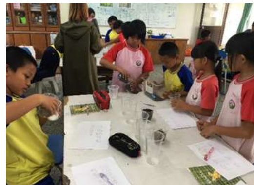
圖 18、學生混合濾杯中的土沙