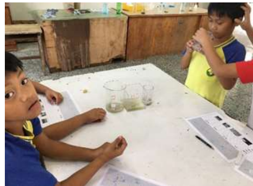
圖 6、觀察杯中水質與生物