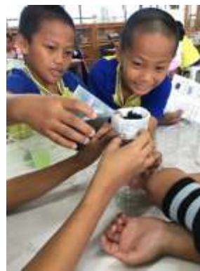
圖 12、進行濾泥水實驗