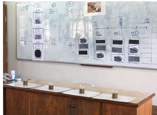
圖 14、濾泥水實驗的結果