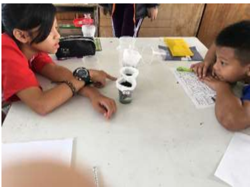
圖 11、認識材質的不同