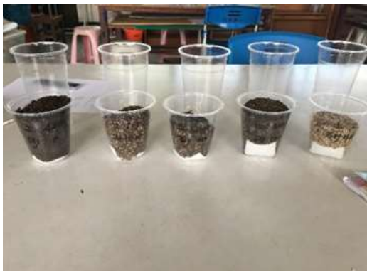
圖 17、五種土沙混合比例不同的濾杯