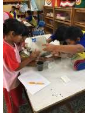
圖 16、學生們合作完成實驗