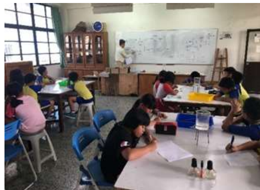
圖 4、將實驗結果紀錄在學習單