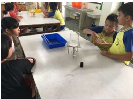
圖 3、學生將蓋玻片蓋在燒杯上