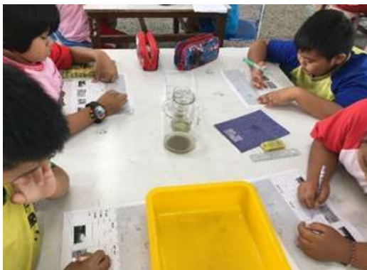
圖 7、紀錄在學習單上