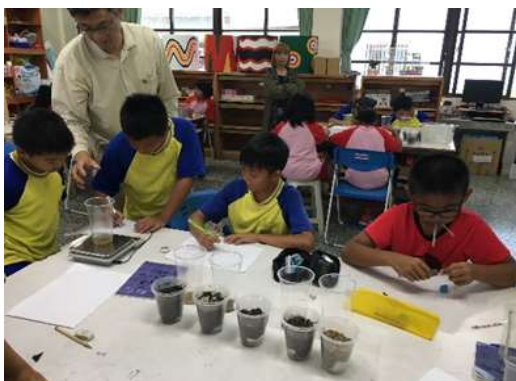
圖 19、用電子秤測量流出的水的重量