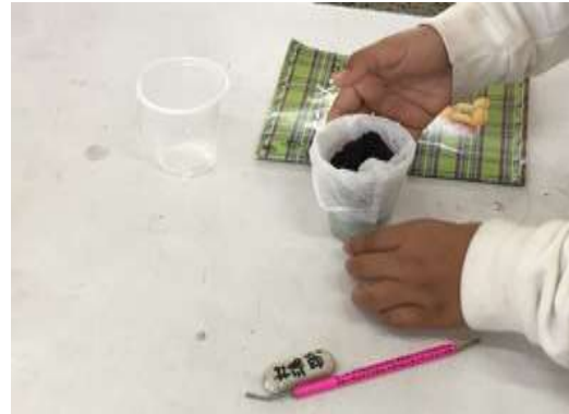
圖 10、學生自己製作濾杯