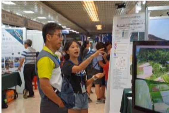
(a) 團隊成員介紹原鄉飛行導覽

本計畫最主要的研究項目為建構專屬原住民族地理環境知識之數位學習模組，針對仍在原鄉之族人，以擴增實境技術輔助年輕族人學生學習地理環境知識，使他們能站在真實的環境中學習數百年前族人傳承下來的知識；針對已經離開原鄉部落族人，則以虛擬實境技術協助建立「虛擬原鄉」，協助年輕族人學生跳脫現實環境，沉浸在三維、動態的原鄉環境中，以學習、認識原鄉的地理環境知識。本次的原住民族科學節即依此二概念設計展覽攤位，並依體驗者的意見回饋修正。未來預計將與更多原鄉部落合作，並讓學生族人體驗，共同增進虛擬原鄉與數位學習平台之成效。