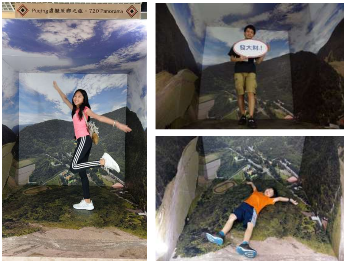
圖3、遊客於720°全天候立體場景內拍照體驗

此場景是建立在宜蘭縣大同國中旁的獨立山(泰雅語為Rqenas)，透過各個角度的無人飛行載具(Unmanned Aerial Vehicle, UAV)航拍影像，組成空中的全景立體場景，現場立體場景由五面2公尺*2公尺的大圖輸出海報牆所搭建而成(圖3)，遊客站在立體場景內拍照，建構出彷彿身處在獨立山上的立體感。