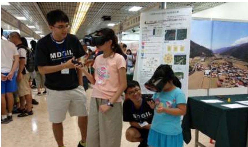
圖 7、體驗者於空中場景向下觀看