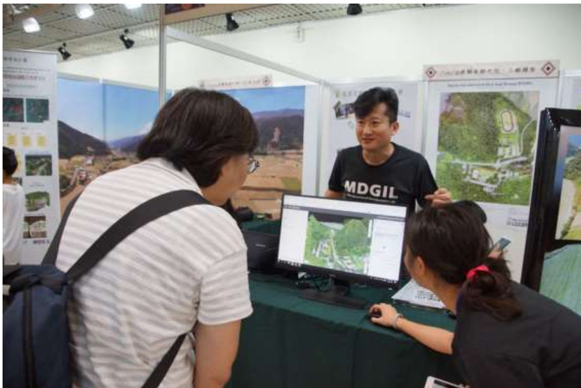
圖 5、Pix4D 雲端版展示三維模型與正射鑲嵌影像