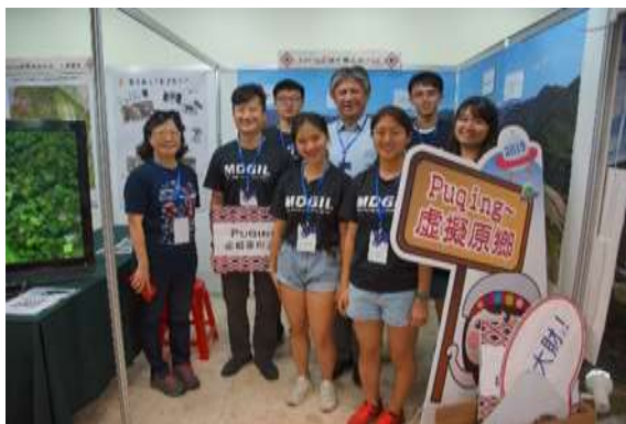
(c) 團隊成員與其他子計畫主持人合影