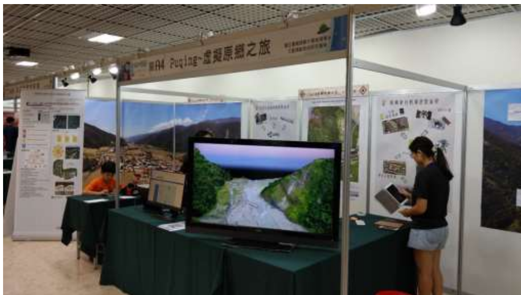
圖 2、Puqing~虛擬原鄉之旅主題館