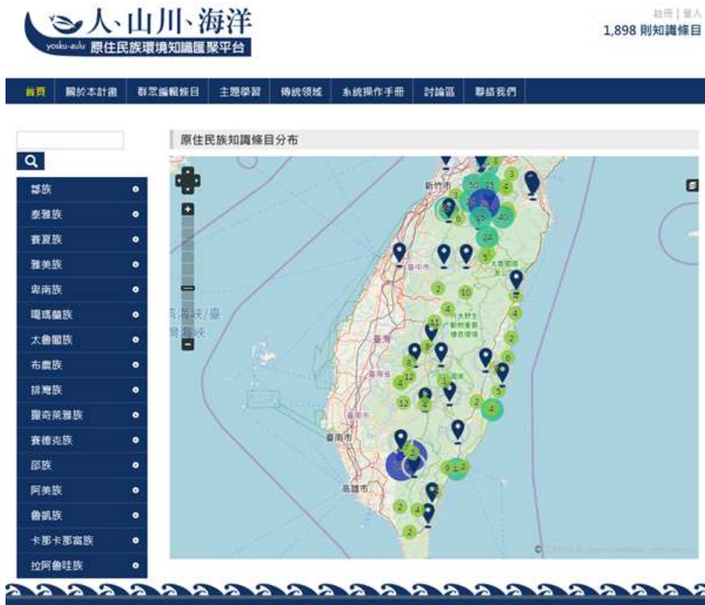
圖 1、原住民族環境知識匯聚平台