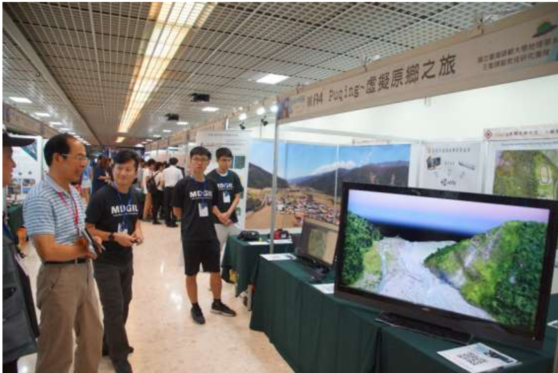
圖 4、以 42 吋大螢幕展示虛擬原鄉飛行模擬