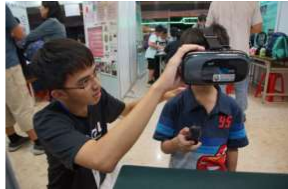
(b) 團隊成員替體驗者戴上頭戴式裝置