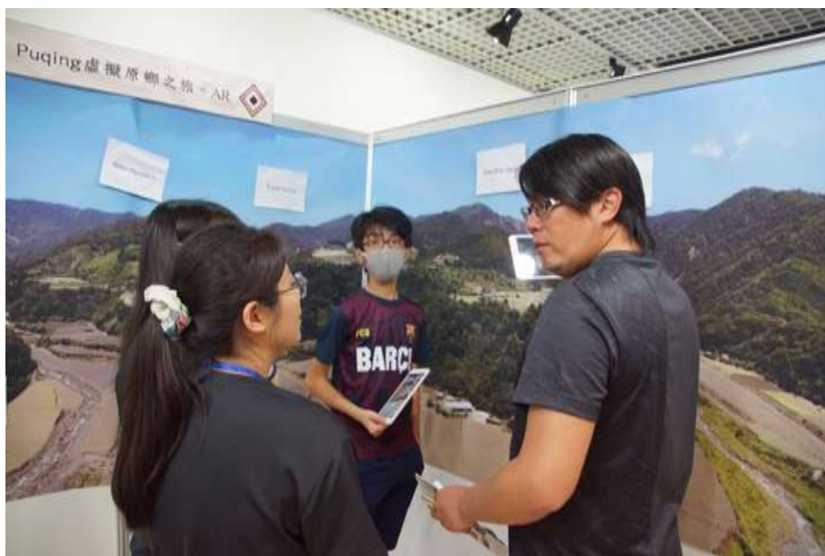
(b) 團隊成員向參觀者解說擴增實境內容