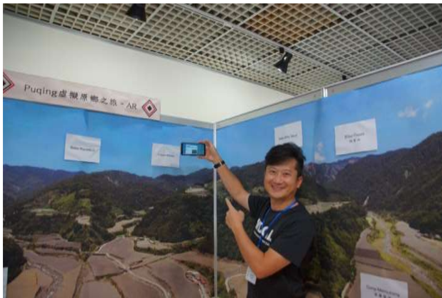
(a) 將手機 APP 面朝山頭方向可顯示對應的知識條目

第四個展區為 AR 擴增實境體驗，場景建立在宜蘭縣大同鄉南山部落溪流交會處(泰雅族語：Tngihan)，透過 UAV 航拍影像建立空中視角的背景，包含周圍的溪流匯流處與數個山頭，將平板擴增實境 APP 面朝對應山頭的方向，即可顯示該山頭在傳統環境知識匯聚平台上的條目(圖 8)，模擬在野外耆老講解時的情境。