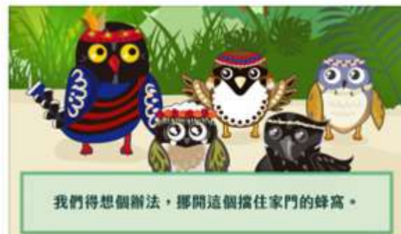
圖 10 故事主角