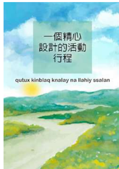
圖 2 電子書「一個精心設計的活動行程」