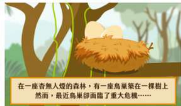
圖 8 故事情節