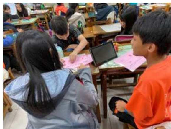
圖 4 海山國小學生閱讀電子有聲書