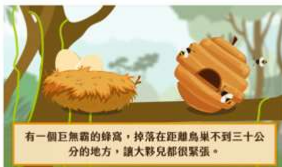
圖 9 待解決問題