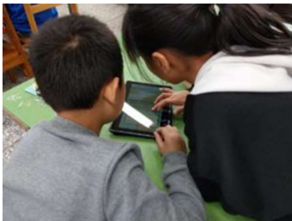
圖 3 南澳國小學生閱讀電子有聲書