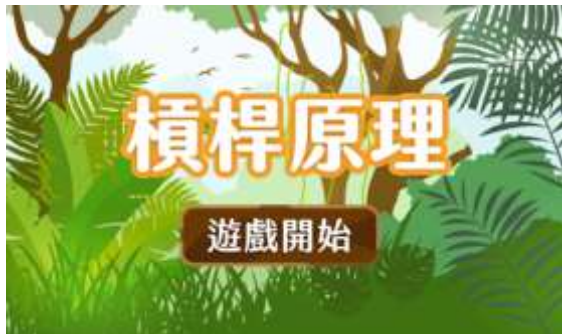
圖 7 APP 遊戲首頁

本研究亦開發相關 APP，內容對應科普文本，藉由 APP 遊戲式的學習方式，有效提升學生學習興趣。