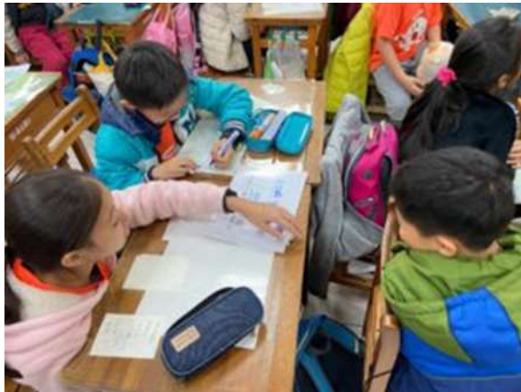
圖5 海山國小學生進行CPS分組討論