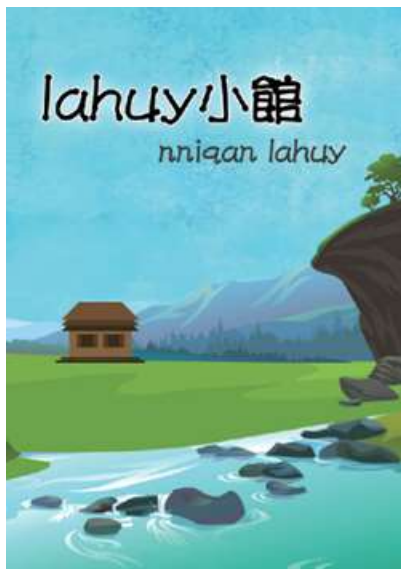
圖 1 電子書「Lahuy 小館」

族語呈現，不同族群文化背景的學生均可閱讀，且中文與族語文發音皆為真人人聲發音，更貼近口語發音，泰雅族語發音由部落族語老師專業錄製，且文本翻譯均由部落耆老進行專業修改，更貼近真實部落文化。閱讀結束後，文本均附隨堂測驗試題，以利學生自我檢測閱讀理解的狀況。電子書文本與人聲音檔均可提供下載至個人行動裝置，以利學生課後進行閱讀。考量泰雅族群語系分支，電子有聲書採用臺灣宜蘭南澳地區的當地語言（賽考利克語）為主要用語。電子有聲書的插畫均依照文本內容手工繪製，且版面設計適合學生閱讀。