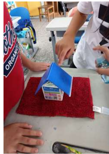
圖6 南澳國小學生進行科學活動

本研究亦開發相關 APP，內容對應科普文本，藉由 APP 遊戲式的學習方式，有效提升學生學習興趣。