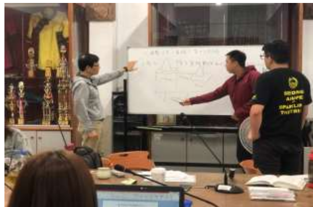
↑LCLIC 聚會討論情景-教師與研究者討論 怎樣解題單元之線段表徵