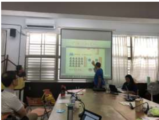
↑LCLIC 聚會討論情景-教師分享數到 30 單元之圖示表徵