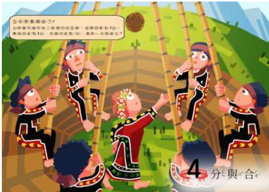
↑一上「分與合」單元的情境扉頁